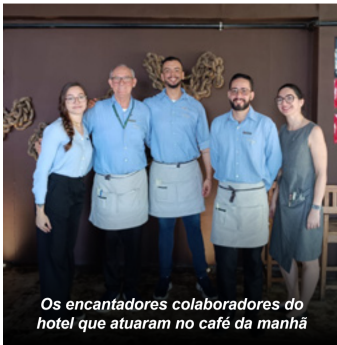
Os encantadores colaboradores do hotel que atuaram no café da manhã